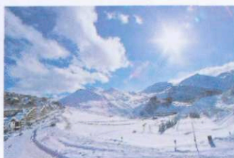
La conca di Prato Nevoso.

Un mondo di sci A una quarantina di chilometri da Cuneo, poco più di mezz'ora basta per entrare nella suggestione delle Alpi Marittime, sfondo del bacino sciabile del Mondolè Ski che comprende le stazioni di Artesina, Frabosa Soprana e Prato Nevoso (queste ultime due collegate fra loro dalla seggiovia biposto Malanotte-Prel). Oltre 130 chilometri di piste da discesa, trentuno impianti di risalita, uno snowpark, aree giochi per bambini e altre attrazioni fanno del comprensorio una meta di forte richiamo per le famiglie. In bassa stagione, dal lunedì al venerdì, lo skipass giornaliero a tariffa intera costa 29,50 euro e include un coupon con il quale consumare gratuitamente, in alcune baite convenzionate, il "pranzo dello sciatore". In offerta speciale l'ingresso agli impianti il martedì e il mercoledì, a soli 20 euro al giorno. Tolti gli sci, si cena in rifugio accompa-